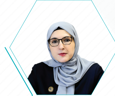
Naida Hota Muminović

Konuşmacı / Speaker İlk, Orta ve Teknik Eğitim Bakanı, Demokratik Kongo Cumhuriyeti Minister of Primary, Secondary and Technical Education, The Democratic Republic of Congo