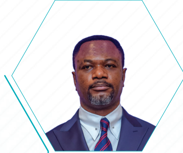
Tony Mwaba Kazadi

Konuşmacı / Speaker İlk, Orta ve Teknik Eğitim Bakanı, Demokratik Kongo Cumhuriyeti Minister of Primary, Secondary and Technical Education, The Democratic Republic of Congo