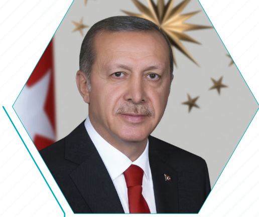
Recep Tayyip Erdoğan

Onur Konuğu / Guest of Honour Türkiye Cumhuriyeti Cumhurbaşkanı President of the Republic of Türkiye